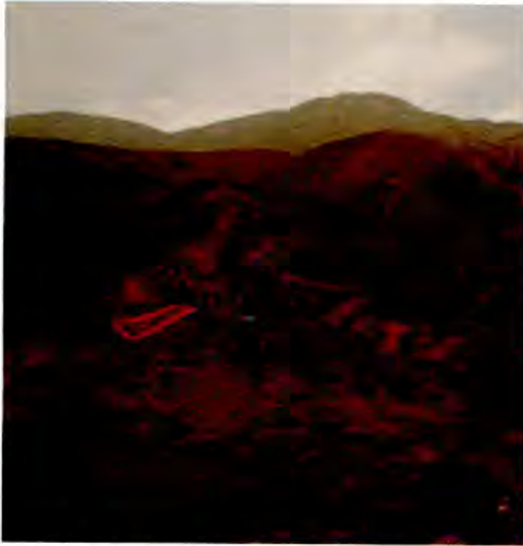
Figura 2. Afiche contra la impunidad, foto de Hermann Schwarz.

Imagen contra la Impunidad (homenaje póstumo a los estudiantes y profesor asesinados) elaborado por los artistas Manuel Figari y Ricardo Wiesse. Una plantilla de 3 metros de largo para reproducir 10 veces una flor de cantuta, depositando una mezcla de arena y tierra de color.