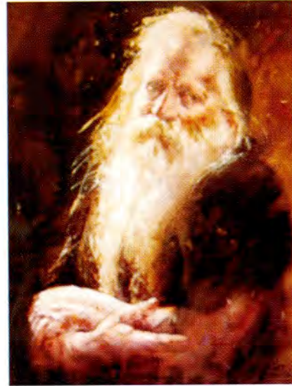
"Santo Thomas Chumbivilcas"