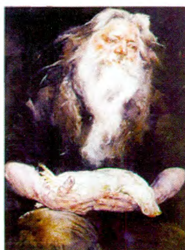
"La aseel blanca"