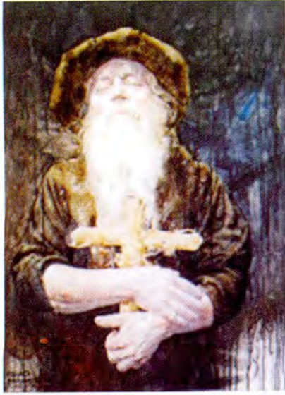
"Domingo de ramos"