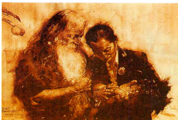
"La línea de la vida se acaba"