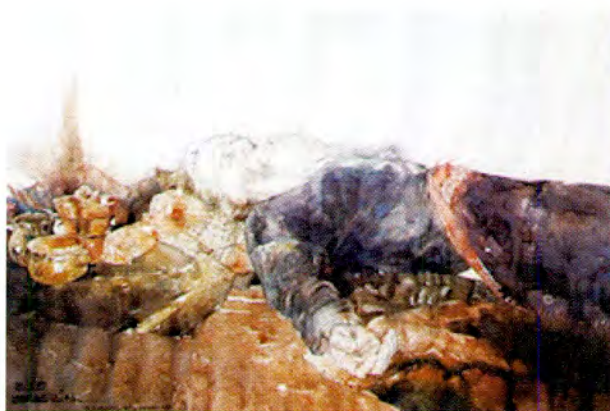
"La esquina del perdedor"