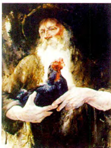
"El gallo de mi padre las manos de mi madre"