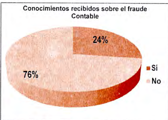
Figura N°02. Conocimientos recibidos sobre el fraude Contable

Del total de los alumnos encuestados, el 76%, manifiesta que en las asignaturas relacionadas a la Auditoría que se dictan en la Facultad de Ciencias Contables y Financieras, no han recibido correcta información acerca del fraude contable; mientras que un 24% de los encuestados considera que si ha recibido información correspondiente a este tema.