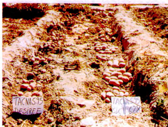
Clon promisorio de papa (SDC91.628) tolerante al estrés de sequía generando en el programa de hibridación y selección del CIP con la Universidad Nacional Jorge Basadre Grohmann de Tacna. Tacna. Pachia, Tacna 950 masl.