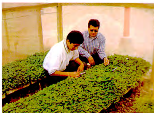
Evaluación de familias híbridas de papa en los invernaderos de la Universidad Nacional Jorge Basadre Grohmann de Tacna. Los Pichones, Tacna, 500 msnm.