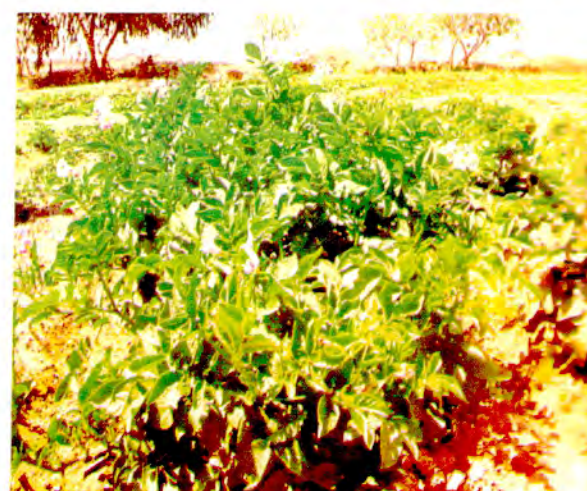
Desarrollo de una nueva variedad de papa mejorada "Tomasa like" (Musuq Tomasa) con genes de resistencia a los virus PLRX, PVY y PVX mediante mejoramiento convencional como una alternativa a una variedad transgénica resistente a virus. El Peligro, Tacna, Perú. 850 msnm.