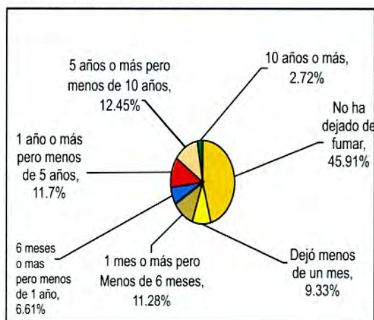
GRÁFICO N° 3. Personal Docente que Labora en Instituciones Educativas de Nivel Secundario Según Tiempo que dejó de Fumar

Al consumir un cigarrillo se producen dos tipos de corrientes de humo: la primera (corriente principal) es aquella que, al aspirar una calada, pasa por el interior del cigarrillo hasta alcanzar los pulmones del fumador activo; la segunda (corriente secundaria) es la que se desprende al ambiente desde el extremo incandescente del cigarrillo que surge de la combustión directa del tabaco y que puede ser inhalada por un sujeto pasivo que respira en ese entorno contaminado. La nocividad de esta corriente secundaria para el fumador pasivo actualmente está fuera de toda duda.